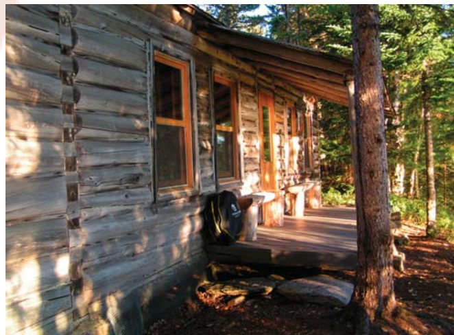
Le refuge Grand-Masti.

Renseignez-vous auprès de la FQM au 514 252-3157 ou sur le site Web : http://www.fqmarche.qc.ca/index1.asp?id=730