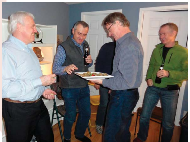
Les bénévoles de la Mauricie.

Le Québec n'est pas la seule province où le Sentier national est en pleine expansion. Ça bouge aussi beaucoup en Colombie-Britannique. Pat Harrison, président de Hike BC, vous invite à visiter leur site Web où vous trouverez plusieurs cartes des sentiers faisant déjà partie du Sentier national. http://www.nationalhikingtrail.org/