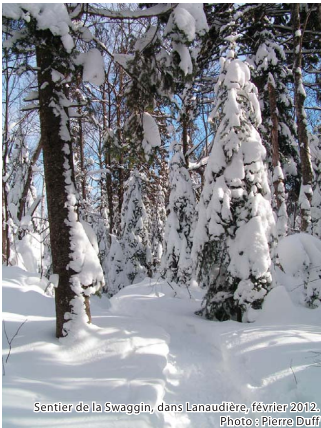
Sentier de la Swaggin, dans Lanaudière, février 2012.

Le Trekkeur est un bulletin d'information qui a pour but de rapprocher tous les intervenants qui oeuvrent à l'achèvement du Sentier national au Québec (SNQ). Il est distribué par courriel à plus de 200 personnes