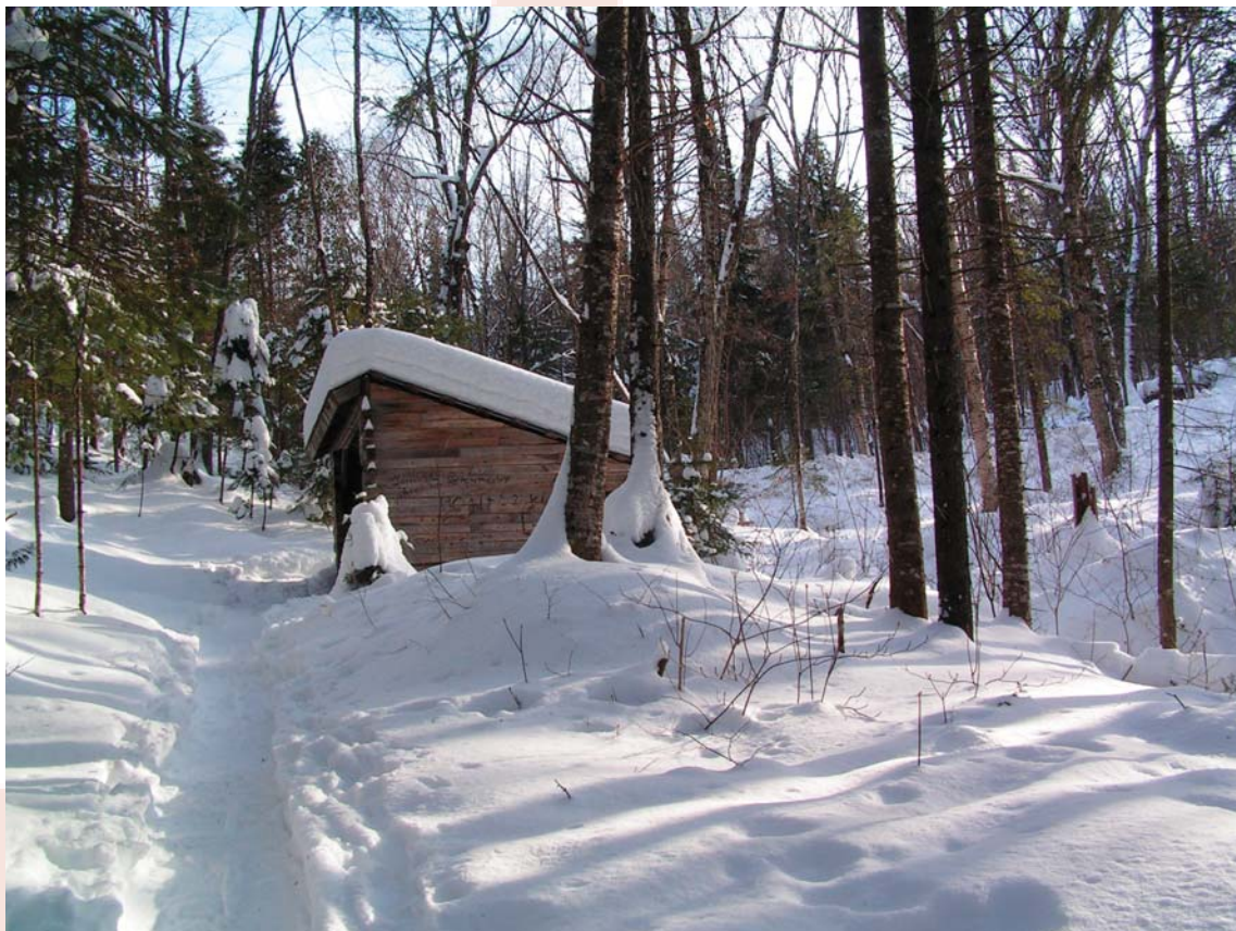
Le lean-to sur le sentier de la rivière Swaggin sera déménagé plus près de la rivière.

Sur un plan un peu moins positif, les municipalités de la MRC, qui versaient toutes une quote-part à la société, ont décidé de cesser ce paiement et de prendre à leur charge l'entretien des différents tronçons du SNQ qui traversent leur territoire. Cette nouvelle façon de faire est en essai pour un an. Espérons que